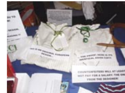
L'exposition sur la contrefaçon – Parlement Européen, janvier 2004