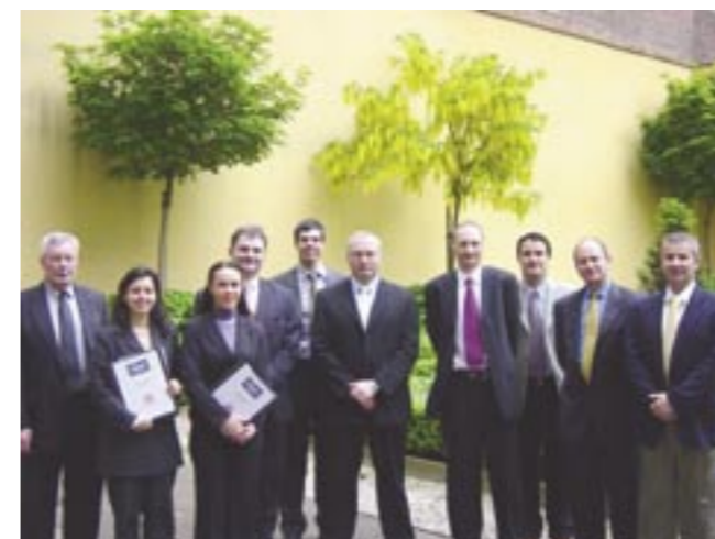
Lancement du Projet DPI

Comme les pays candidats devront encore faire des efforts de restructuration pour se conformer aux critères de l'adhésion à l'UE, y compris la capacité à faire face à la pression de la concurrence, aux forces du marché et au rapprochement de leur législation avec l'acquis communautaire, Euratex a accepté de contribuer activement à la diffusion de l'information sur l'acquis communautaire dans le domaine des DPI. Ainsi, Euratex a organisé, en collaboration avec TAIEX (Technical Assistance and Information Exchange office; DG Élargissement) et l'industrie du