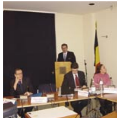
14 janvier 2004: Conférence de presse "Chine", Bruxelles.

Les performances des exportations chinoises de produits textiles et d'habillement vers les Etats-Unis et vers l'Union Européenne ont