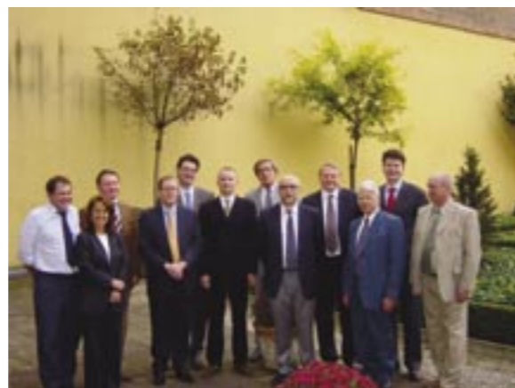
Octobre 2003 – Rencontre avec une délégation Russe

Dans la foulée de cette embellie dans les relations indo-européennes il a été question au début de l'année de la signature d'un accord bilatéral avec l'Inde sur le modèle de ceux signés avec le Sri Lanka et le Brésil: quotas additionnels pour les derniers mois de 2004 contre une amélioration permanente de l'accès au marché indien. Euratex a marqué son accord de principe pour qu'un tel processus soit entamé mais uniquement à condition que les concessions indiennes soient réelles et mesurables et que les engagements pris puissent être garantis avec certitude et à l'avance. Depuis lors, le projet n'a pas avancé d'un pouce.